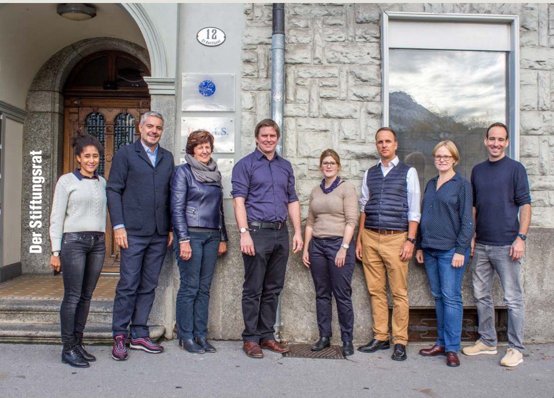
Gruppenbild Stiftungsrat vom November 2017 Siegerehrung prix jubla