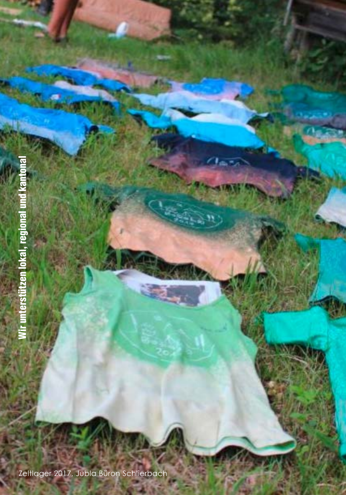
Zeltlager 2017, Jubla Büron Schlierbach